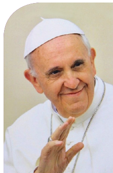
El Papa Francisco

“Todos nosotros, en la vida, necesitamos educadores; personas maduras, sabias y equilibradas que nos ayuden a crecer en la familia, en el estudio, en el trabajo y en la fe”.