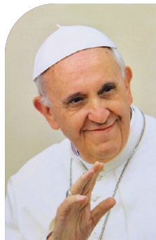
El Papa Francisco

“Todos nosotros, en la vida, necesitamos educadores; personas maduras, sabias y equilibradas que nos ayuden a crecer en la familia, en el estudio, en el trabajo y en la fe”.